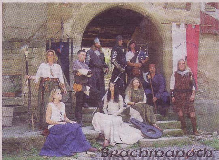
„Brachmanoth“ zeigen historisches Lagerleben.

RegioMedien verlost 5x2 Karten für das Mittelalter-Event! Rufen Sie am Montag, 9. Juli, um 9 Uhr unter Tel. 07022/ 2131-52 an, die ersten Anrufer erhalten die Karten. - Der Rechtsweg ist ausgeschlossen.