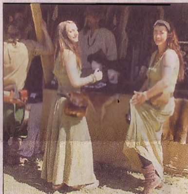
„Allerley kurzweyl“ beim Stauferspektakel: Schwertkämpfer und Marktfräuleins.