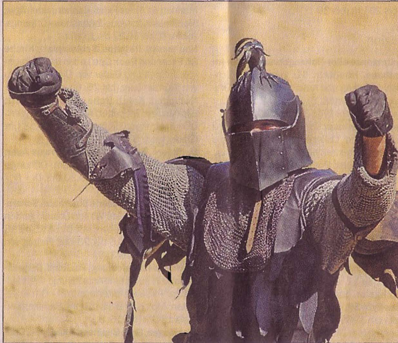
Gut gerüstet: Ein Ritter demonstriert Stärke.

„Allerley kurzweyl“ ist angesagt, wobei die Ritter, Gaukler, Musikanten und Artisten im Mittelpunkt stehen. Gezeigt wird darüber hinaus mittelalterliches Handwerk wie Schmieden, Weben, Instrumentenbau, Schnitzerei, Kerzenziehen, Seifensieden, Spinnen sowie das Herstellen von Salben und Elixieren. Andere Programmhöhepunkte sind die täglich zweimal aufgeführten Turniere der Ritter von der „Schwarzen Lanze“ aus dem bayerischen Dietesheim. Je sechs bis acht Reiter messen sich, hoch zu Ross, im